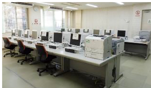
総合情報センター端末室