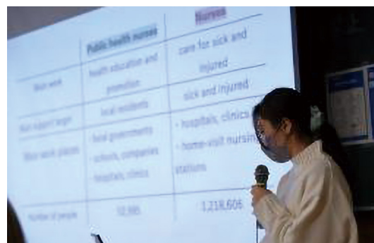
令和3年度パーツ大学とのオンライン交流講義

一方渡航制限に伴いオンラインを利用した研修プログラムは活発化した。短期研修は海外協定校等が主催したプログラムと本学の授業の一部として実施した学習体験に分類されるが、令和2年度合計265名の本学学生が参加している。また協定校以外の大学からも学習機会が提供され、愛知県が募集した「精華大学グローバルサマースクール2021」には本学学生2名が1週間の研修プログラムに参加した。短期研修以外ではオーストラリアのニューサウスウェールズ大学のオンライン交換留学プログラム（11カ月）に学生1名、国連食糧農業機関（FAO）オンラインインターンシップ・フェローシップ（2～3カ月）に令和2年度1名、令和3年度2名が参加した。