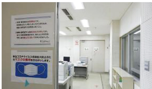
総合情報センター端末室入口

端末室入口にマスク着用をお願いを掲示した。密を避けるため、パソコン1台おきに使用禁止として席の間隔をあけた。使用可能なパソコンのキーボードはナイロン袋で覆い、椅子は利用できるパソコンの台数にあわせて減らした。入口と出口を分けて一方通行とした。常に窓を開けて換気をした。令和3年度までは、閉館時に使用可能パソコンのキーボードとマウス、机の上をアルコールで消毒した。令和4年度は、端末室入口に手指消毒用のアルコールを設置した。