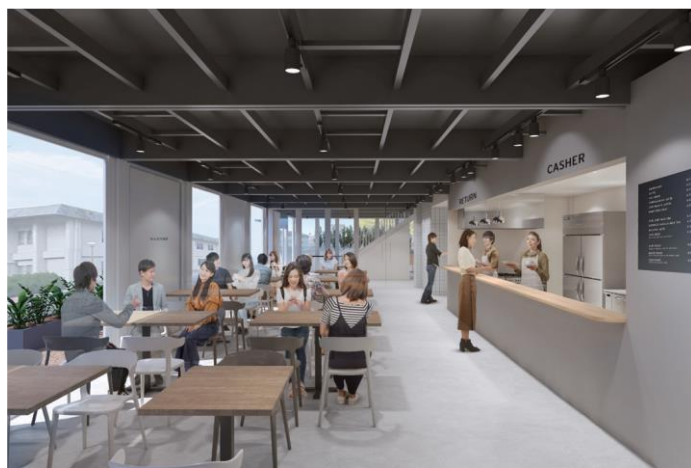
滝子カフェテリア（仮称）完成イメージ（外観および内観）